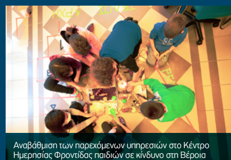
Αναβάθμιση των παρεχόμενων υπηρεσιών στο Κέντρο Ημερησίας Φροντίδας παιδιών σε κίνδυνο στη Βέροια