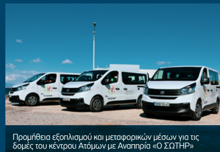
Προμήθεια εξοπλισμού και μεταφορικών μέσων για τις δομές του κέντρου Ατόμων με Αναπηρία «Ο ΣΩΤΗΡ»