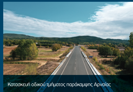
Κατασκευή οδικού τμήματος παράκαμψης Αρναίας