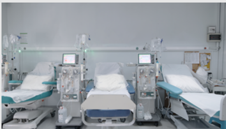
Προμήθεια ιατροτεχνολογικού εξοπλισμού για το Γενικό Νοσοκομείο Θεσσαλονίκης «Άγιος Παύλος»