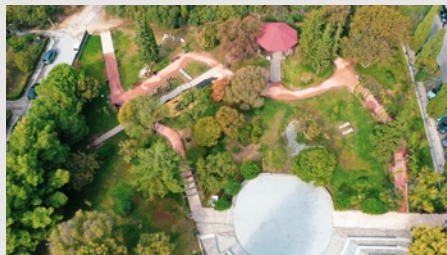
Ανακατασκευή πάρκου Ούλωφ Πάλμε στη Νέα Κρήνη