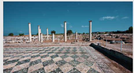
Αποκατάσταση, συντήρηση και ανάδειξη ανακτόρου Αρχαίας Πέλλας