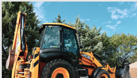
Προμήθεια εξοπλισμού για την αντιμετώπιση φυσικών καταστροφών στον δήμο Πυλαίας Χορτιάτη