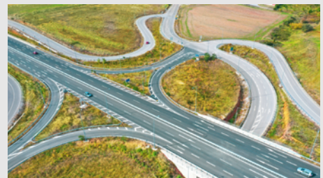
Οδικός άξονας Θεσσαλονίκης Κιλκίς Δοϊράνης, τμήμα ΑΚ Μαυρονερίου