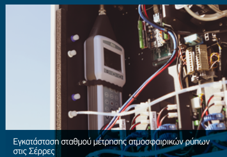
Εγκατάσταση σταθμού μέτρησης ατμοσφαιρικών ρύπων στις Σέρρες