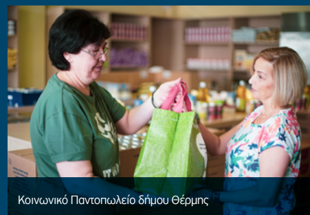
Κοινωνικό Παντοπωλείο δήμου Θέρμης