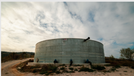
Βελτίωση της ποιότητας και ποσότητας ποσίμου νερού στις δημοτικές κοινότητες της Δ.Ε. Μυγδονίας του δήμου Ωραιοκάστρου